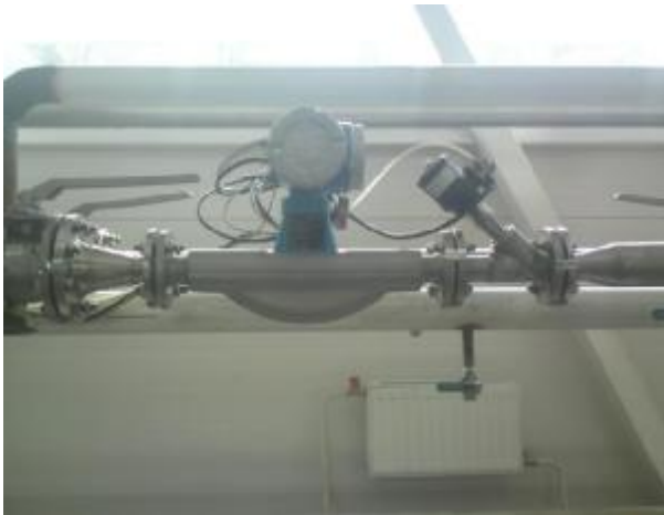
Фото 1. Расходомер Promass и клапан