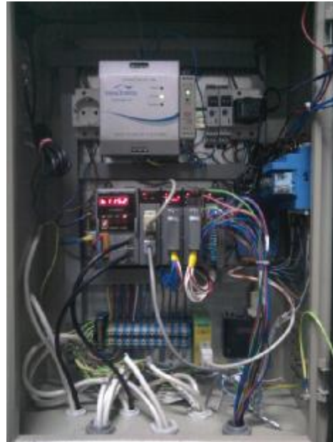
Фото 3 и 4. Шкаф УСПД

После установки и пуска комплекса в эксплуатацию, пломбируются следующие места и соединения: