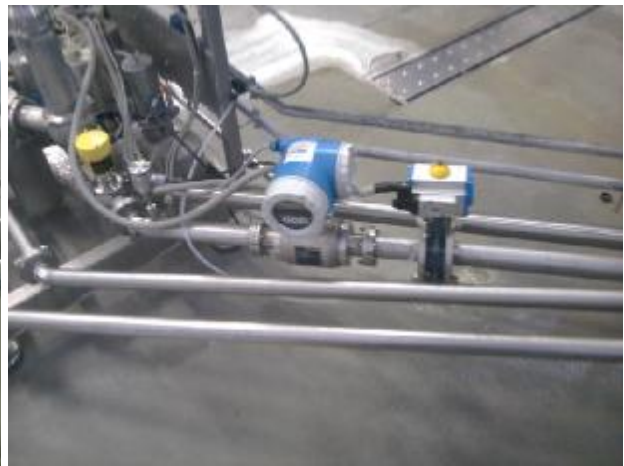
Фото 2. Расходомер Promag и дисковый затвор